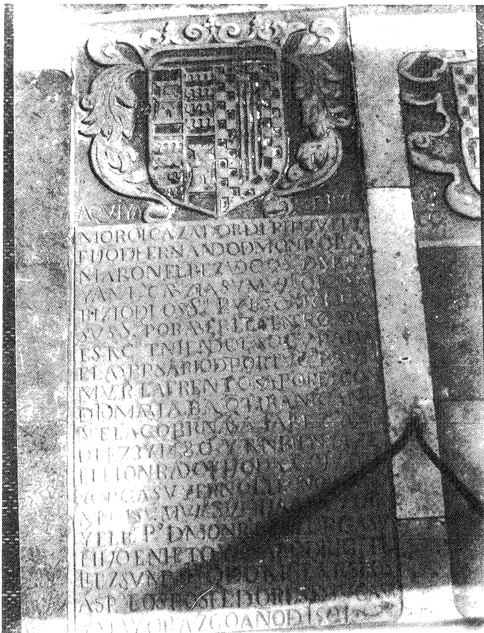
Fotografía de la Lápida de Antona García en la iglesia de San Julian, en Toro. Año de 1498.